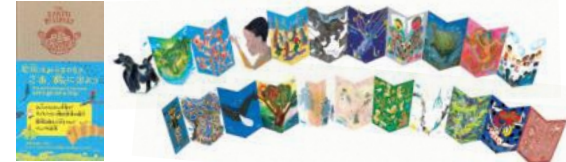
『ちきゅうパスポート えほん作家から世界の子どもたちへ』BL出版 2023

12月13日[水]～26日[火] 10:00～18:00 富山市ガラス美術館(TOYAMAキラリ) 5Fギャラリー2