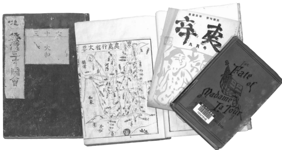
むかって右より 『The fate of Madame La Tour』 / 『辛夷』昭和27年9月号 / 『和漢三才圖會』巻37