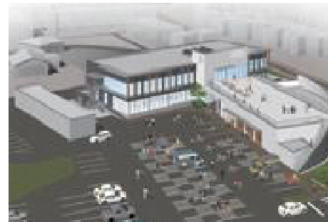
新しい大山会館のイメージ図

「まちの活力を向上させる」をコンセプトに景観の恵みを取り込んだ多世代交流拠点、大山会館(*)内にリニューアルオープンします。 外観は常願寺川扇状地をイメージし、2階の図書館の広い窓から立山連峰を眺望できます。