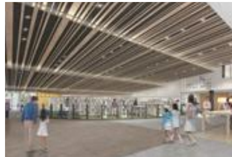
新しい図書館のイメージ図

「おおさわのふらり」をコンセプトにふらりと立ち寄りたくなる多世代交流拠点、大沢野会館(*)内にリニューアルオープンします。 中が見通せる楕円形のガラスの壁面と開放感ある高い天井、カーブがある書棚が特徴です。