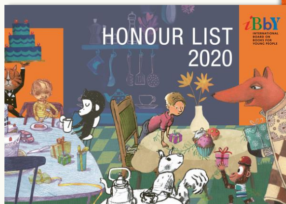
▲「IBBY Honour List 2020」(IBBY発行)

国際児童図書評議会 (IBBY) が2020年に60の国と地域から選んだ48言語、約200冊の世界の子どもの本を解説とともに展示します。