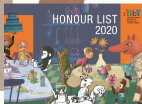
▲『IBBY Honour List 2020』(IBBY発行)