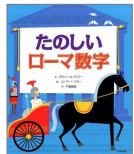
たのしいローマ数字