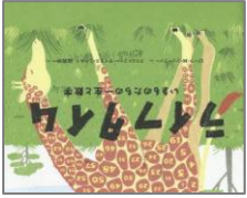
『ライオンタイム いきものたちの 一生と数字』 ローラ・M. シュー マン／著 クリストファー・サ イラス・ニール／え 福岡伸一／やく ポプラ社

シヤガイモは1個、サツマ イモは1本。同じイモなのに、 どうして数え方がちがうので しょうか？ わたしたちの身 のまわりにある、たくさん のモノの「数え方のルール」を 紹介します。