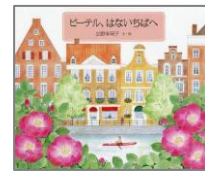
えほん 『ピーテル、 はなないちばへ』 広野多珂子／文・絵 福音館書店

ピーテルは、 はな 花やのお父さん のわすれものを、いちばにとど けに行くことになりました。 ひとりでポートにのって、ぶじ にとどけることができるか な？