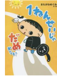
K913 『1ねんせいじゃ だめかなあ？』 きたがわめぐみ／ 作・絵 ポプラ社

1ねんせいのいっちゃんは、 スーパーへ、やすうりのたま ごをかいにいきました。けれ ども、みせのおじさんに、「た まごはおとなしかかえない よ」といわれてしまいます。