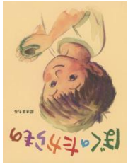
『ぼくは、たからもの』 鈴木まもる／著 アリス館

男の子がとしよかんへしゆ つばつします。まずは、めいろ をこえていきましよう。 男の子といっしょにクイズ やまちがいがしをしていく うちに、としよかんのつかい方 がマスターできます。